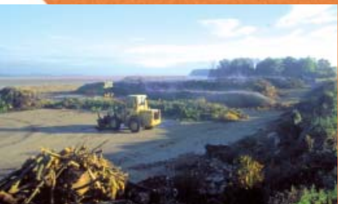
La plate-forme VERT COMPOST à Epiais-Rhus.

Les matières non végétales : les cailloux et les gravats qui endommagent les broyeurs mais aussi le verre, les pots en plastique, les bouteilles et les déchets toxiques (piles) qui polluent le compost. Ces matériaux sont extraits manuellement avant le compostage ce qui augmente nos coûts d'exploitation. Sans ce tri manuel, on aurait encore un déchet à l'issue du traitement !