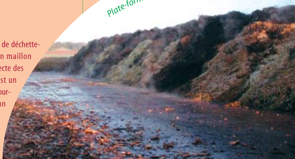
Plate-forme de compostage VERT COMPOST

Pour tout renseignement, n'hésitez pas à nous contacter directement :