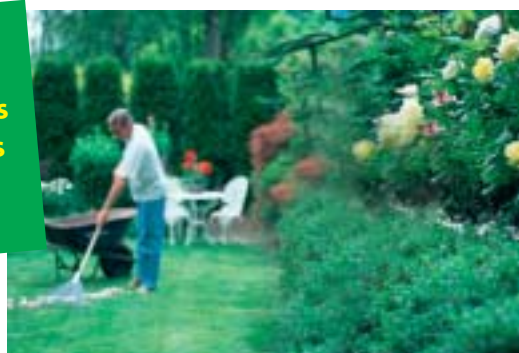
Déchets verts issus du jardin