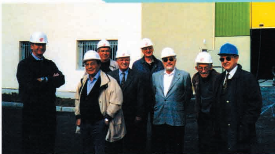
Le 14 octobre 2004, le bureau du comité syndical visite le centre de tri peu avant la fin des travaux.