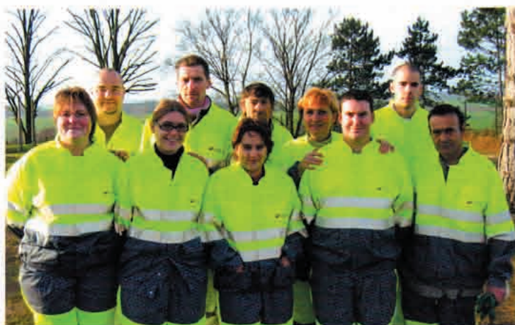
Le personnel du centre de tri au grand complet

La création du centre de tri a favorisé l'emploi de 6 habitants de Vigny et des communes avoisinantes :