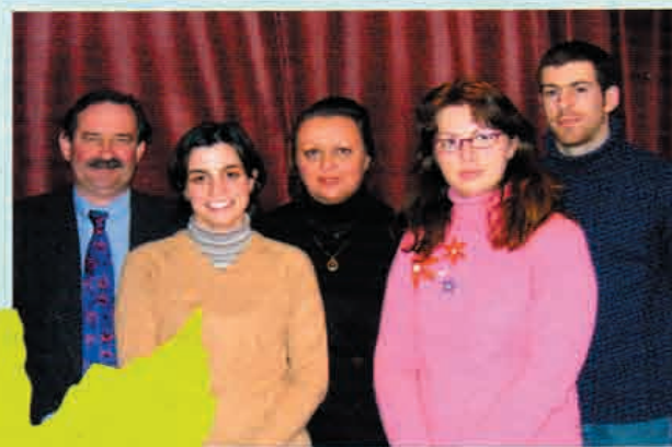
L'équipe du SMIRTOM du Vexin

L'équipe du SMIRTOM du Vexin emménagera prochainement dans ses nouveaux bureaux attenants au centre de tri.